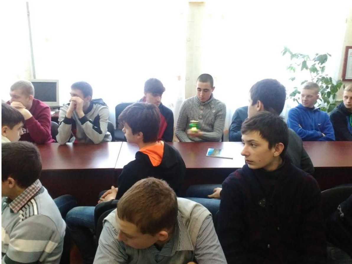
Виховний захід «Пам'ять героїв стукає в наші серця»