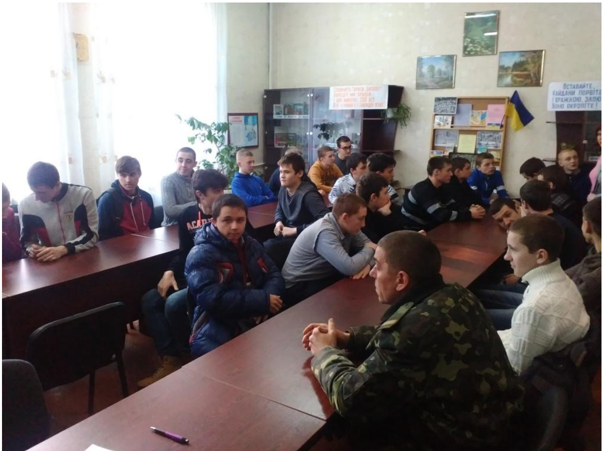
Виховний захід «Пам'ять героїв стукає в наші серця»