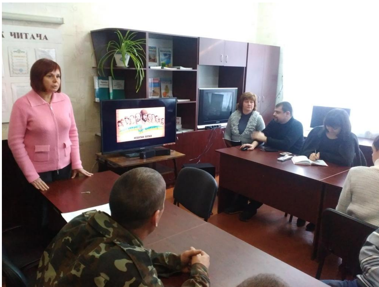
Виховний захід «Пам'ять героїв стукає в наші серця»