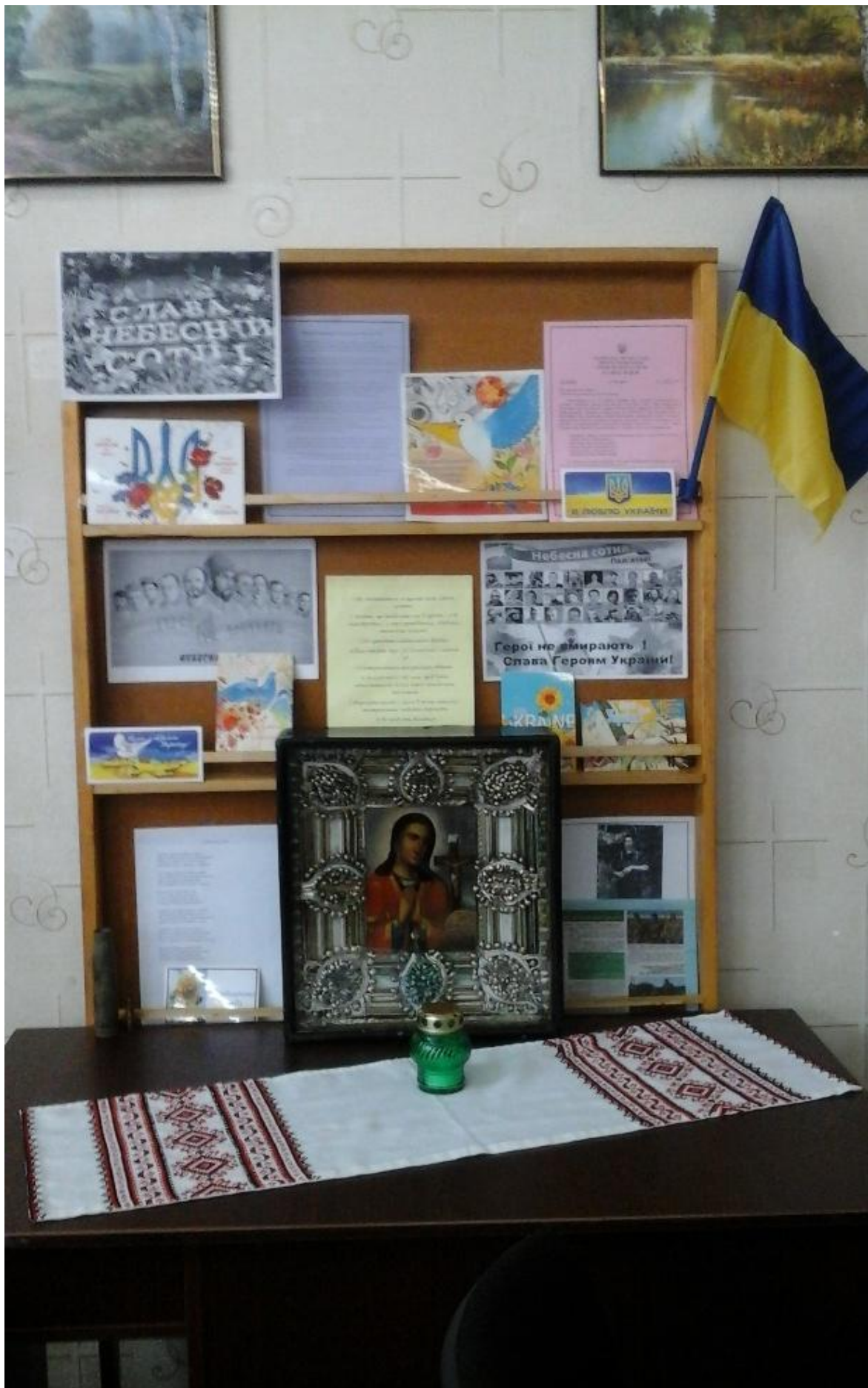
Книжкова виставка до виховного заходу «Пам'ять героїв стукає в наші серця»»