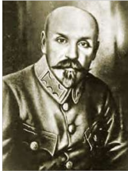
Генерал Олександр Греков

Раніше про цю людину було написано багато. Проте, інформація переважно була розкидана по закордонних виданнях. Тому прізвище генерала зустрічається в двох варіантах: Греків і Греков. Частина відомостей чекала на дослідників у радянських архівах.